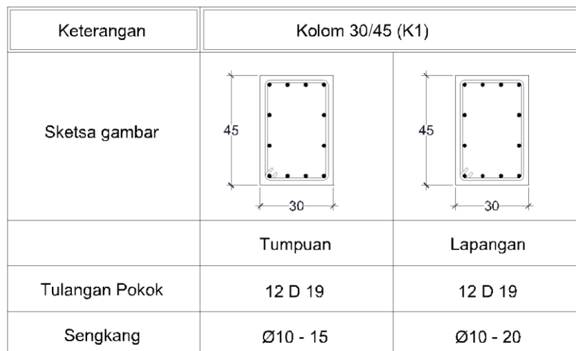
Gambar 1: Detail penulangan kolom